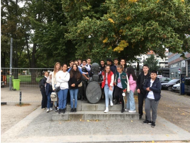
Auf dem Weg zum Humboldt-Forum an der Statue von Adolph Diesterweg, Burgstraße, 10178 Berlin